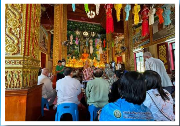
(24 ก.พ.67) บจ.สหโคเจน กรีน ร่วมทำบุญประเพณี สักการะพระธาตุอินทร์แขวน ประจำปี 2567 บ้านน้ำพุ ม.7 ต.ป่าสัก อ.เมือง จ.ลำพูน