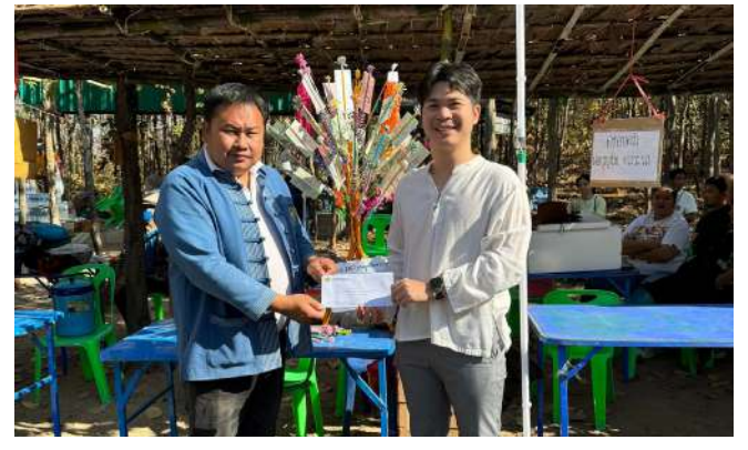
(29 ก.พ. 67) บจ.สหกรีน ฟอเรสต์ ร่วมทำบุญทอด ผ้าป่าสามัคคีโรงเรียนบ้านวังตะแบก ต.วังตะแบก อ.พรานกระต่าย จ.กำแพงเพชร เพื่อนำเงินรายได้พัฒนาคุณภาพการศึกษา