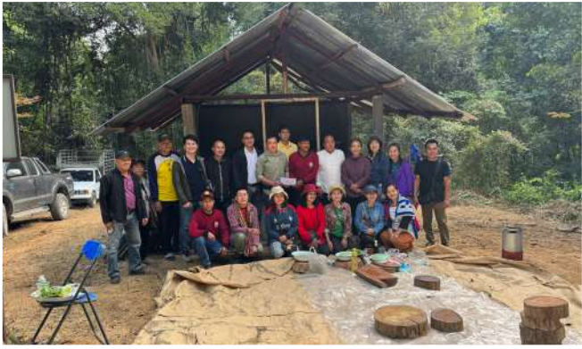
(14 ม.ค.67) บจ.สหโคเจน กรีน เข้าร่วมกิจกรรม ประเพณีชุมชน งานบวงสรวงป่าชุมชนน้ำห้วยไฟ บ้านทรายทอง ม.16 ต.ป่าสัก อ.เมือง จ.ลำพูน ประจำปี 2567