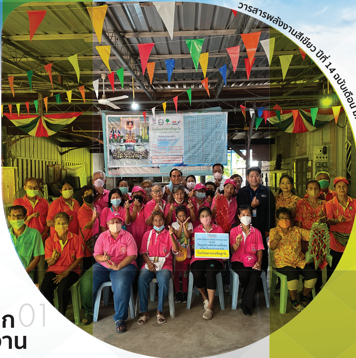
วารสารพลังงานสีเขียว ปีที่ 14 ฉบับเดือน มกราคม-มีนาคม 2566